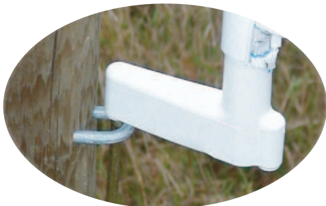
Accroche basse. Le piquet possède 2 ancrages pour une bonne fixation au sol.