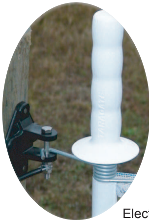
Electrification du ruban