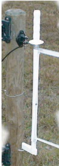
Accroche haute de la barrière sur le poteau

15 m de ruban permettant de réaliser une barrière de 6 m.